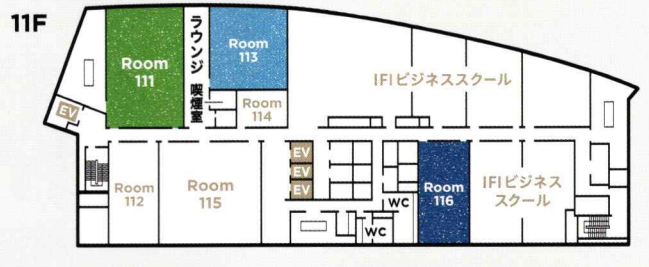
11F Room 111