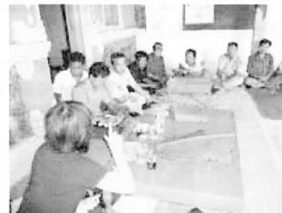
〔一般社団〕あいあいネット「インドネシア・西部バリ国立公園における地域コミュニティとの共存・協働関係構築プロジェクト」