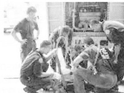
松阪地区広域消防組合(三重県)「フィジー・水難救助技術研修」